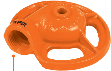
Entrada de agua 3/4"