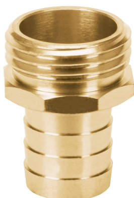
Conexión macho 3/4''