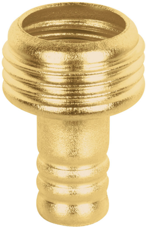
Conexión macho 3/4"