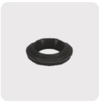
Empaque antifuga con diseño cónico