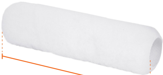
Largo 9" (23 cm)