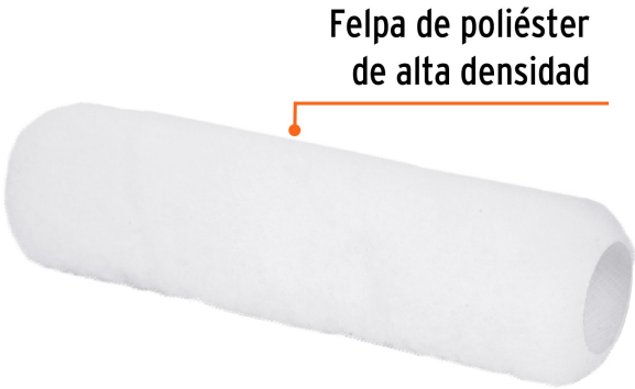
Felpa de poliéster de alta densidad

Fabricado en México bajo las estrictas especificaciones de GRUPO TRUPER