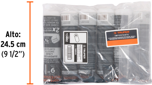
Alto: 24.5 cm (9 1/2")