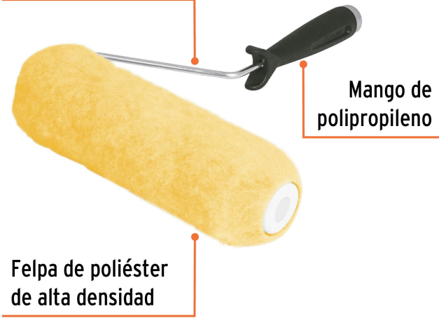
Mango de polipropileno