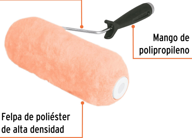
Mango de polipropileno