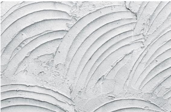
Superficie muy rugosa