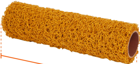
Largo 9" (23 cm)