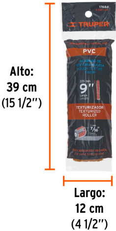
Alto: 39 cm (15 1/2")