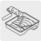
Canales para escurrimiento