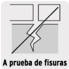
A prueba de fisuras