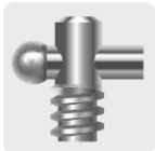
Tornillo con manivela para aplicar mayor presión