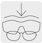
Sobre lente compatible con la mayoría de lentes graduados