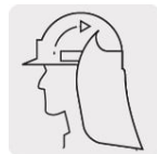
Fijación hook and loop