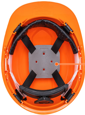
Almohadilla más gruesa para mayor comodidad