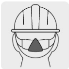
Ajuste de marraca