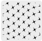
Tejido de punto en bolsas