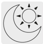
Uso de día y noche