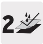
Capa de material PVC / Poliéster