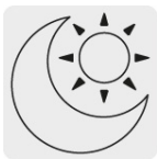
Uso de día y noche