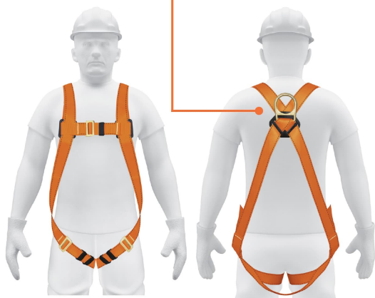
1 Anillo "D" de acero forjado