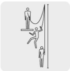
Distancia mínima al suelo desde el punto de anclaje 6 m