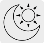
Uso de día y de noche