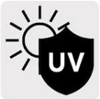
Resistente contra rayos UV