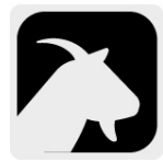
Piel de cabra