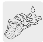
Nitrilo arenoso para máximo agarre