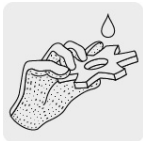
Nitrilo arenoso para máximo agarre