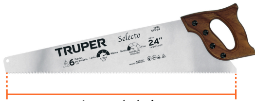
Largo de hoja 24" (60 cm)