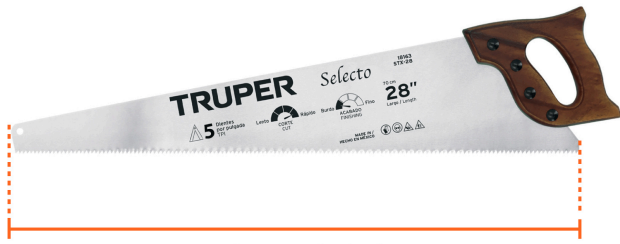
Largo de hoja 28" (70cm)