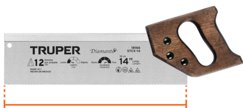
Largo de hoja 14" (35 cm)