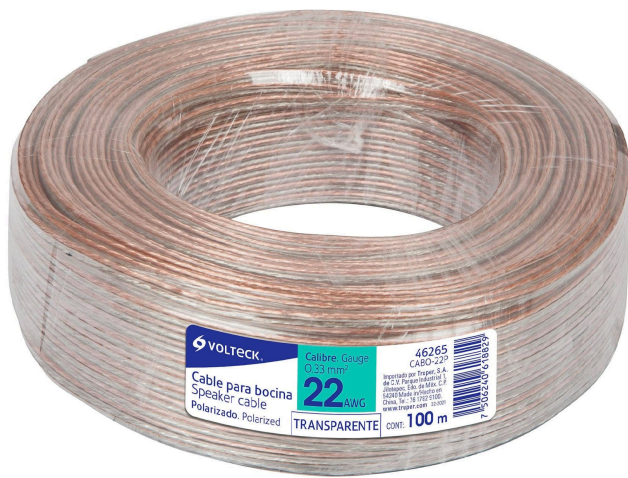
Rollo de 100 m