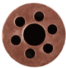
Diámetro de salida 2.4 mm