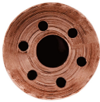
Diámetro de salida 2.8 mm