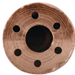
Diámetro de salida 3.3 mm