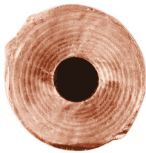
Diámetro de salida 1.5 mm