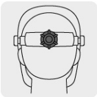
Ajuste de matraca