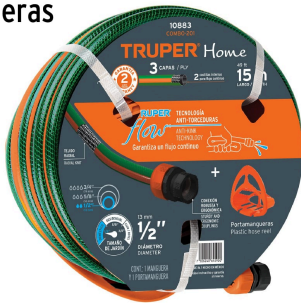
Manguera reforzada de 3 capas