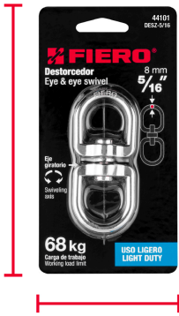
Largo 7 cm (3")