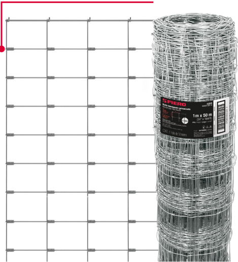
Empalmes en las bisagras