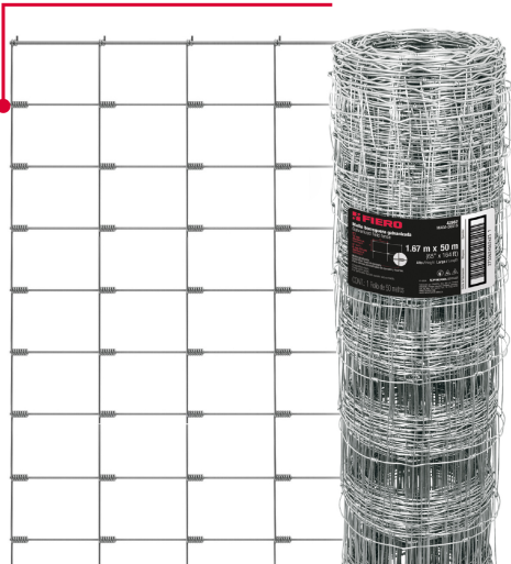
Empalmes en las bisagras