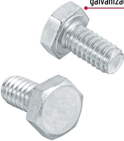
Acero con recubrimiento galvanizado