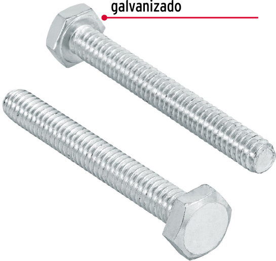
Acero con recubrimiento galvanizado