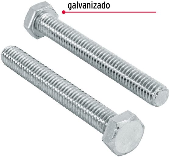
Acero con recubrimiento galvanizado