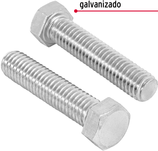
Acero con recubrimiento galvanizado