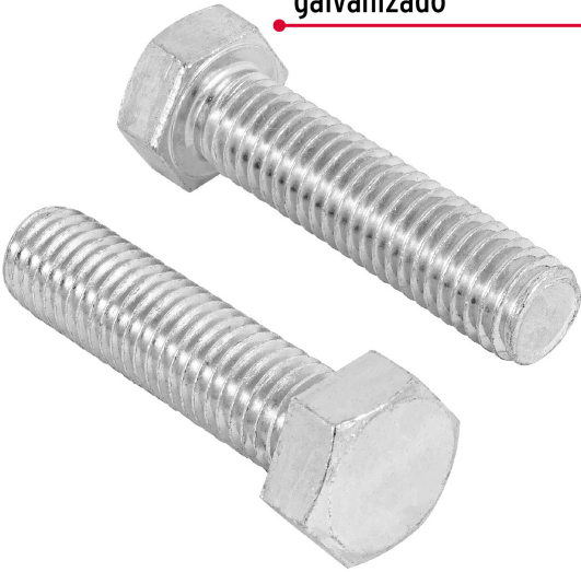
Acero con recubrimiento galvanizado