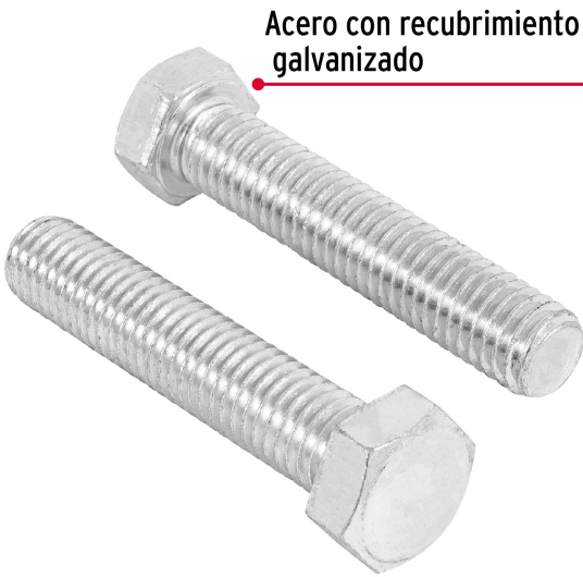
Acero con recubrimiento galvanizado