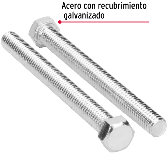
Acero con recubrimiento galvanizado