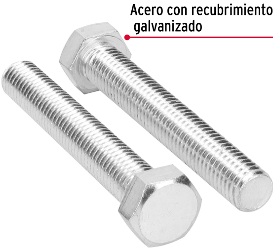
Acero con recubrimiento galvanizado