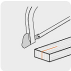
Corte a 90°