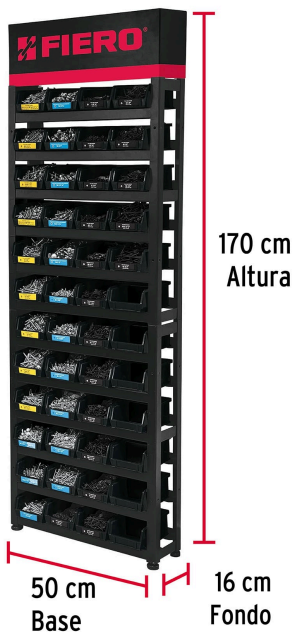
170 cm Altura