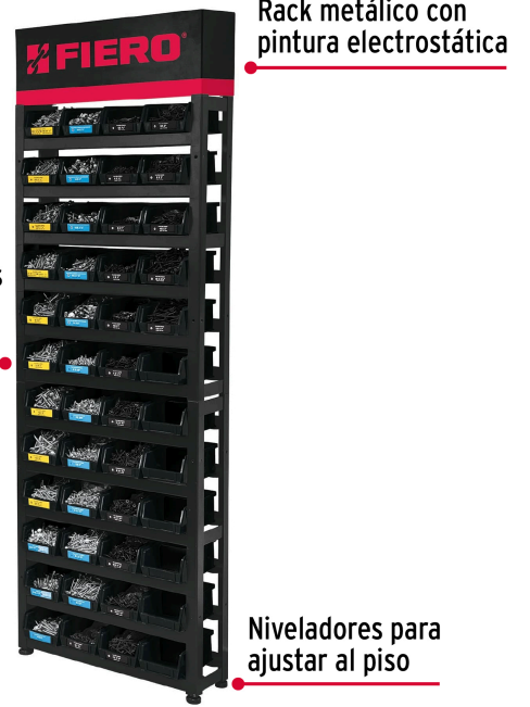
Rack metálico con pintura electrostática