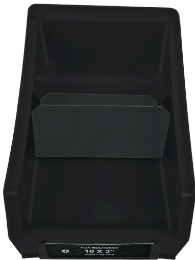
Gaveta para 2 códigos