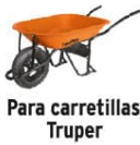
Para carretillas Truper