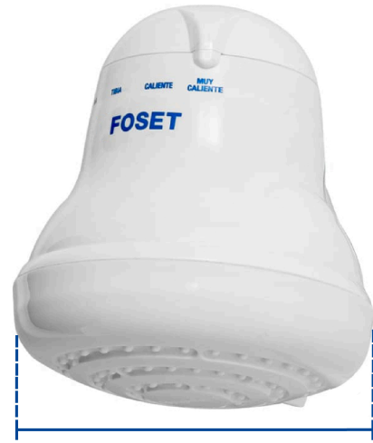
Diámetro 14.5 cm