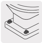
Para fijar la base del W.C. al piso